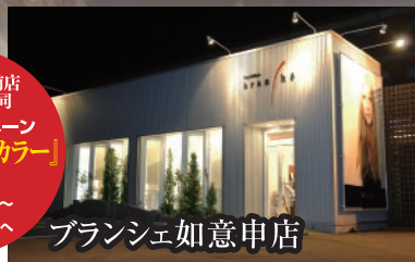
ブランシェ如意申店