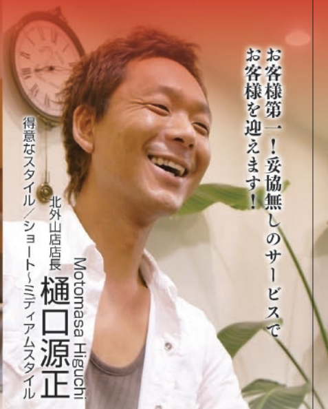
得意なスタイル / ショートミディアムスタイル