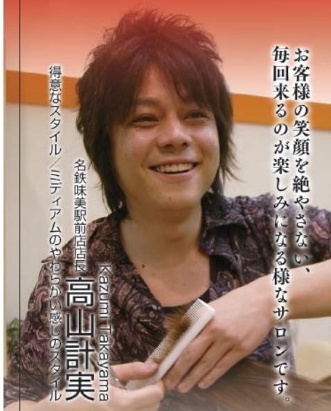
得意なスタイル / ミディアムのやわらかい感じのスタイル