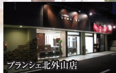
ブランシェ北外山店

小牧市北外山2986-2 ストーンフィールド1F TEL.0568-41-7477