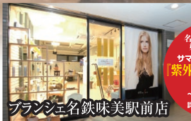
ブランシェ名鉄味美駅前店